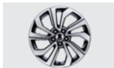
18인치 다이아몬드 커팅 휠

25,650,000 25,190,000 22,900,000 (2,290,000) (-46만원)