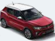
바디컬러 체리 레드