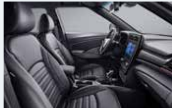
레드 스티치 인테리어 (블랙 헤드라이닝) * 리미티드 에디션 전용