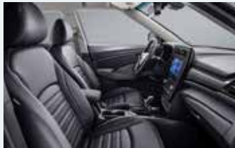
블랙 인테리어 (그레이 헤드라이닝)