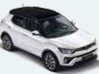
바디컬러/아웃사이드 미러 그랜드 화이트