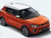
바디컬러 오렌지 팝