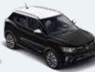
바디컬러 스페이스 블랙