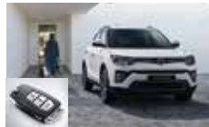
스마트키 시스템(오토 클로징)