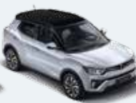
바디컬러/아웃사이드 미러 사일런트 실버