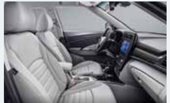
소프트 그레이 인테리어 (그레이 헤드라이닝)