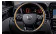
열선 스티어링 휠