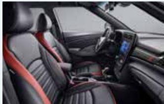
바건디 투톤 인테리어(블랙 헤드라이닝)