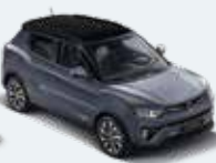
바디컬러/아웃사이드 미러 플래티넘 그레이