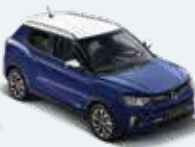
바디컬러 덴디 블루